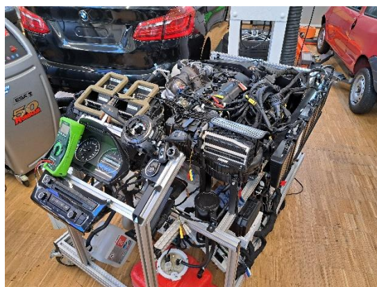
Vollfunktionsfähiger BMW Motor