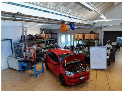
WST Ausschnitt vom Atelier 3

Am 9. August 2023 konnten wir den Einführungstag durchführen. Die jungen Berufsleute werden auf die Ausbildung eingestimmt. Wir erklären ihnen den Kursbetrieb, die Berufsfachschule wie auch die Anforderungen der beruflichen Grundbildung. Zur Ausbildung gehören Pflichten und Kompetenzen. Dies ist jeweils ein wichtiger Part. Das gemeinsame Mittagessen in der SBB Kantine zeigt auch auf, wo die Lernenden sich verpflegen können. Weitere Verpflegungsmöglichkeiten: es stehen auch 4 Mikrowellen für die Selbstversorgung zur Verfügung, sowie bei Bilen Imbiss.